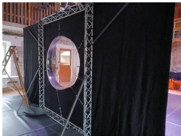
scénographie recto-verso